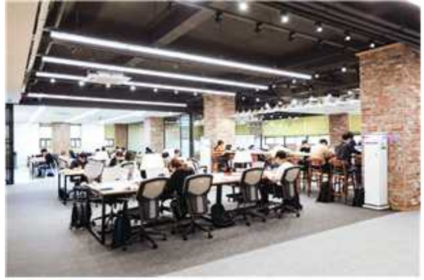
창파도서관 창의융합프라자 #2(Library)