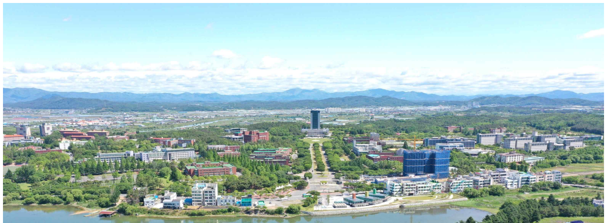
대구대학교 캠퍼스(Daegu University Campus)