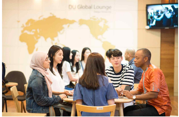
글로벌 라운지(Global Lounge)