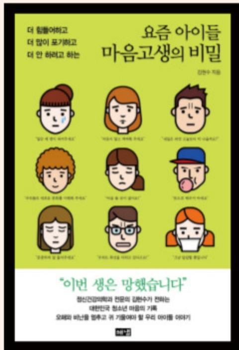
요즘 아이들 마음고생의 비밀

학과에서 소모임으로 한 학기에 책 5권 읽기를 해 오고 있다. 학교에서 이렇게 교수님들의 서재를 털겠다고 했을 때 매우 반가웠다. 학생들이 읽었으면 했던 책, 학생들에게 추천하고 싶었던 책들을 소개할 수 있는 기회가 있어 고맙다. 2만 여명의 학생 중 몇 명이나 추천 책을 읽을지 모르겠지만 단 한명이라도 읽어준다면 감사하겠다. 그리고 그들의 소감 또한 들을 수 있는 기회가 있었으면 좋겠다.