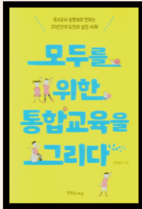
모두를 위한 통합교육을 그리다